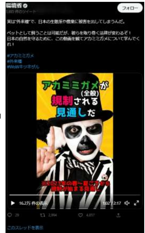
アカミミガメの規制内容のSNS発信