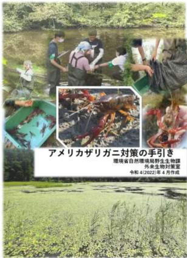
アメリカザリガニ対策の手引き 環境省自然環境局野生生物課 外来生物対策室 令和4(2022)年4月作成