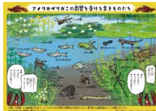
アメリカザリガニによる影響のSNS発信