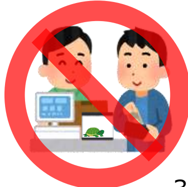
販売・頒布・購入